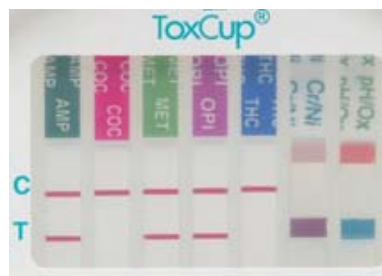
Eksempel på aflæsning:

I KONTROL(C) området skal der være en farvet streg. Når der ikke fremkommer nogen streg i et specifikt testområde, er testen antageligt positiv for det pågældende stof.