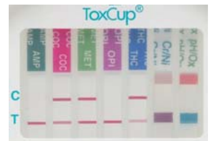
Eksempel på aflæsning:

Ingen streg ud for KONTROL(C) området: testen ugyldig , selvom der er streger i testområdet. Gentag testen med en ny ToxCup®.