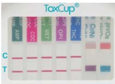
Eksempel på aflæsning:

Tydeligheden af stregerne kan variere, men hvis de er synlige, er det et Negativt resultat.